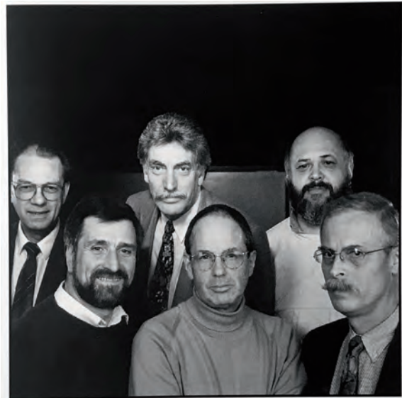
HET BESTUUR VAN DE FOTOBOND BNAFV.