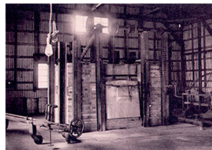
▲ Vanaf het begin produceerde Nikon optisch glas. In 1923 begon Nikon echter met de bouw van een glasoven voor research-doeleinden, die een capaciteit had van 500 kilo. Die research bleek een zeer groot voordeel bij het ontwerpen van objectieven.

Het Duitse team verbeterde verrekijkers (waarvan er in 1918 15.000 werden verkocht!) en ontwierp spiegeltelescopen. Het hielp ook bij de ontwikkeling van een serie objectieven van het Tessar-type en Acht, die twee jaar langer bleef, bij het ont-