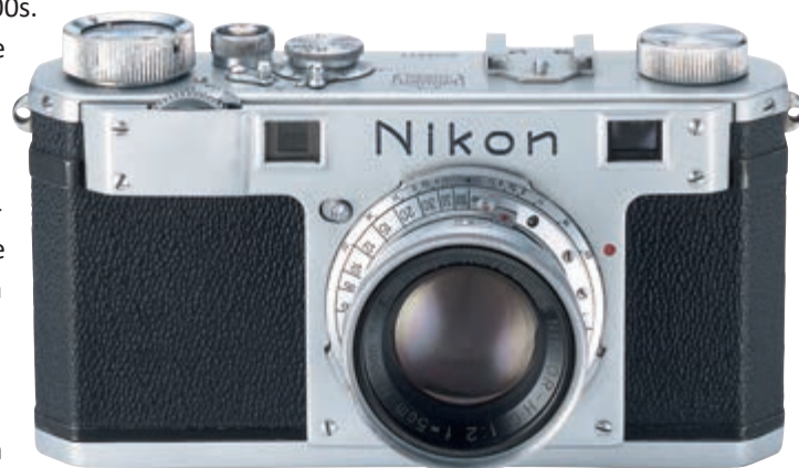
▲ De Nikon 1, de allereerste Nikon die in productie ging, was met zijn opnameformaat van 24 x 32mm niet echt een fullframe-camera.

Het objectief zou Nikon later verkopen aan de firma Aires. De Nikon 1, de eerste Nikon-camera die echt in productie ging, was een camera die de sterke punten van de Leica en de Contax in zich verenigde, gecombineerd met eigen details. Nikon moest met zijn allereerste camera opboksen tegen de gevestigde camerafabrikanten Canon en Minolta, en hield een achterdeurtje open door de objectieven mechanisch compatibel met Canon en Leica te laten zijn. De objectieven zouden ook aan de basis van Nikon's succesverhaal staan. Nikon zou de complete serie objectieven er in nog geen vier jaar uitstampen. Allereerst de al voor Canon ontwikkelde 50mm f/3.5 (1945), daarna de 50mm f/2 (1946), de 135mm f/4 (1947), de 85mm f/2 (1948), de 35mm f/3.5 (ook 1948), en de 50mm f/1.5 (1949). Deze objectieven werden waarschijnlijk allemaal door Saburo Murakami ontworpen, wat menselijk gesproken bijna onmogelijk was. Het werk werd deels vereenvoudigd doordat de Amerikanen de Zeiss-patenten tot oorlogsbuit verklaard hadden. Belangrijker nog was de hulp van grote aantallen zogenaamde 'wiskundemeisjes': vrouwelijke medewerkers gewapend met goniotabellen en rekenlinealen. Die zorgden weliswaar voor enige libidineuze onrust bij mannelijke collega's, maar ze functioneerden bijna net zo goed als de een decennium later ingevoerd computers.