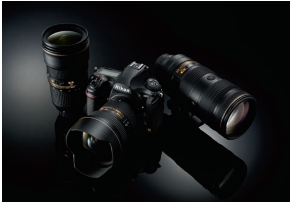
▲ De D850 verenigt net als de D800(E) een camera die eigenschappen combineert, die tot dan toe onverenigbaar werden geacht.

In de afgelopen honderd jaar heeft Nikon een ongelooflijke ontwikkeling doorgevoerd. Toch is Nikon hetzelfde blijven doen in al die jaren: een bedrijf dat objectieven en camera's maakt die precies dat doen wat een veeleisende fotograaf zou willen. Laat andere merken dan maar zich concentreren op marketinghypes, Nikon maakt gewoon nog steeds camera's en objectieven als bezongen door Paul Simon in Kodachrome.