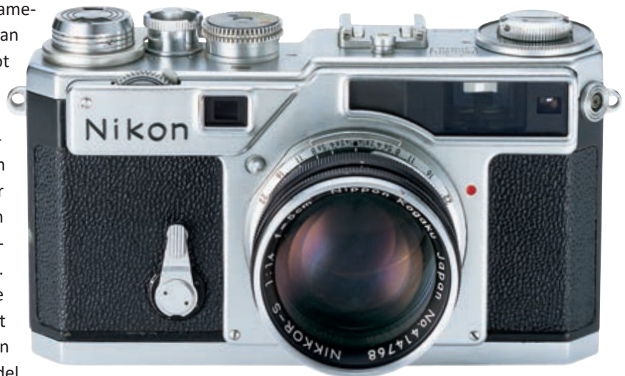
▲ De Nikon SP uit 1958 wordt gezien als de beste meetzoekercamera ooit gemaakt.

wordt dan ook vaak gezien als de beste meetzoekercamera ooit gemaakt. Hij had kaders voor niet minder dan zes verschillende brandpuntsafstanden, van 28mm tot en met 135mm, de Leica M3 slechts voor drie. De kaders bij de SP waren ook kleurgecodeerd en bovendien was er een verlichting van de kaders mogelijk. Het duurde 23 jaar voordat Leica de zes kaders in de zoekers wist onder te brengen. De titanium sluiters van de SP was veel robuuster, en kon niet verbranden wanneer je de camera buiten op tafel legde (brandglaseffect). Die sluiters heeft Leica tot op heden niet. De synchronisatiesnelheid was hoger, het was de eerste camera met een -werkende- motordrive, het grootste aantal objectieven tot wel 1000mm en een echte macrolens en je hoefde de filmtransporthandel maar één keer te bewegen, en de aansluiting voor de flitskabel stak niet in je oog zoals bij de Leica. De opvolger van de SP, de SPX had zelfs al ttl-meting, ook iets waar Leica-gebruikers nog decennia op zouden wachten. Ook had de SPX een zoom-zoeker, en zo iets zal Leica wel nooit meer ontwerpen. (De opvolger van de SP is alleen dankzij het succes van de Nikon F niet meer in productie gegaan.)