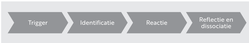
Figuur 1.1 Mindfucking: van trigger tot beknelling

Na korte tijd besef je ineens dat er sprake is van een knellende emotie. Tegelijkertijd verschuift ook het onbewuste proces van zelfafwijzing naar het bewuste niveau. Je bent je nu bewust van de beknelling en vindt het heel verkeerd van jezelf dat je daarin terecht bent gekomen. Je probeert dus om er zo snel mogelijk weer van af te komen en stopt het weg, om het maar niet te hoeven voelen. Hiermee begint de poging tot dissociatie en de strijd tegen het beknellende gevoel. En het bizarre is nu dat de beknelling hierdoor alleen maar verder toeneemt. Na de vermeende afwijzing door een ander volgt nu dus een zelfafwijzing. Dit zorgt ervoor dat je vanuit afweer reageert, in plaats van vanuit eigen kracht. Figuur 1.1 geeft dit proces – dat zich binnen luttele seconden afspeelt – schematisch weer.