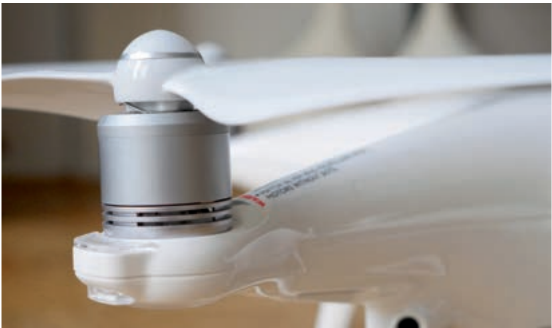
Een close-up van een van de motoren van een DJI Phantom 4. Rechtsonder is ook een van de camera's ten behoeve van de obstakeldetectie zichtbaar.

De propellers worden aangedreven door elektrische motoren, die aangestuurd worden door de vluchtcomputer. Van alle elektronica in een drone zijn het de motoren die de meeste energie gebruiken, tot wel 80% van de capaciteit van de batterij. De stroomtoevoer naar de motoren wordt geregeld door elektronische snelheidsregelaars, ook wel aangeduid als electronic speed controllers (ESCs).