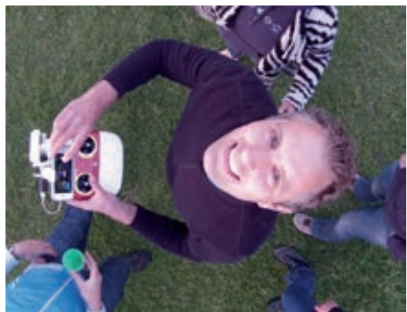
Een 'dronie' van de auteur