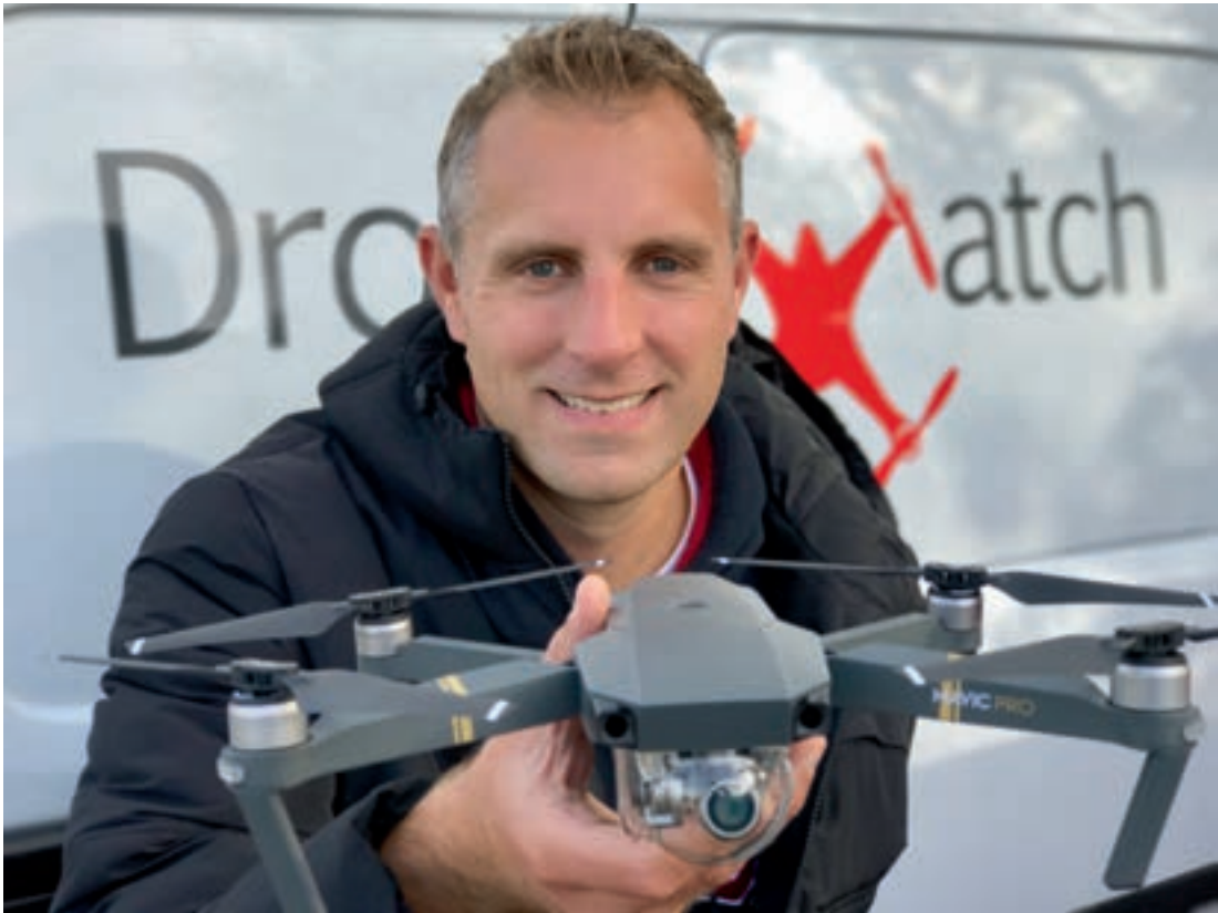
Dankzij mijn betrokkenheid bij dronewatch.nl heb ik al veel verschillende drones in de praktijk mogen uitproberen.