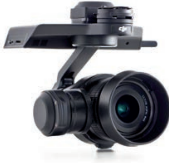
De Zenmuse X5R van DJI is een Micro Four Thirds (MFT) camera die 4K-video in het RAW-formaat kan opslaan.