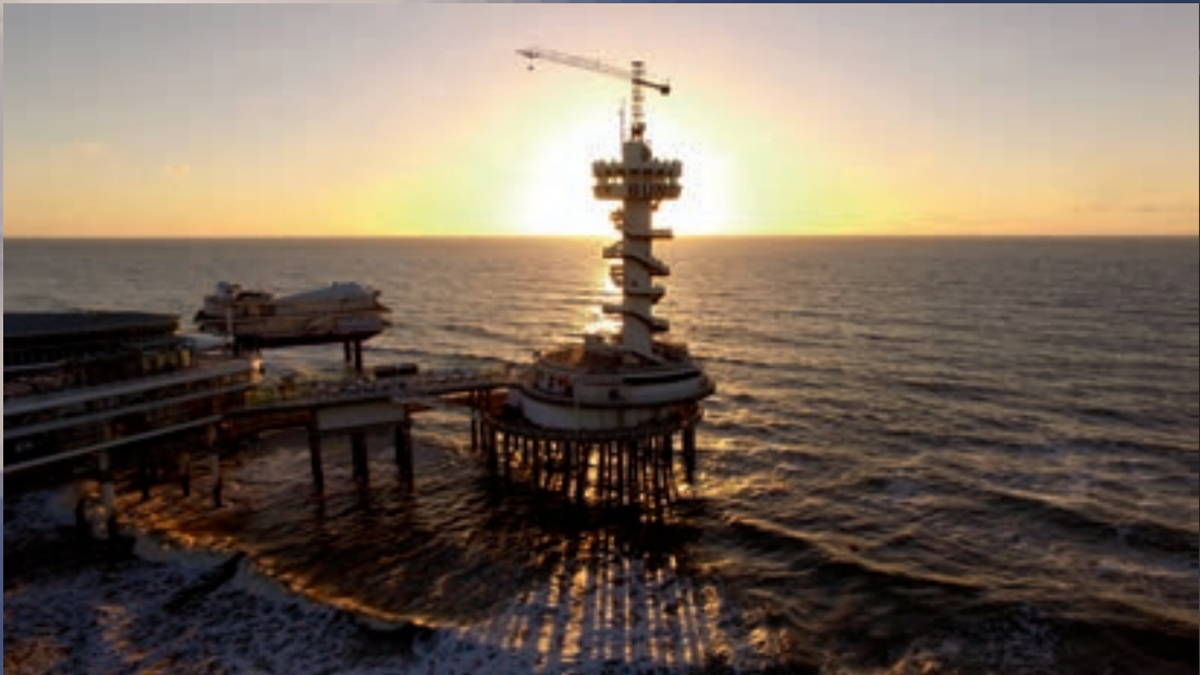
Pier van Scheveningen bij zonsondergang.