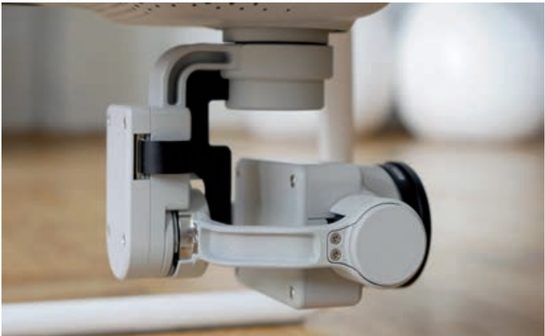
Detailopname van een gimbal. Een delicaat stukje mechatronica!

De gimbal is misschien wel het meest complexe stukje mechatronica van een cameradrone: het is een elektronisch gestabiliseerde cameraophanging die het schommelen of schuinhangen van de drone compenseert, waardoor u zeer stabiele filmbeelden kunt maken. Ook voor fotografie is een gimbal van belang: u kunt de camera draaien en/of kantelen en de horizon blijft netjes recht, zelfs als de drone schuin hangt.