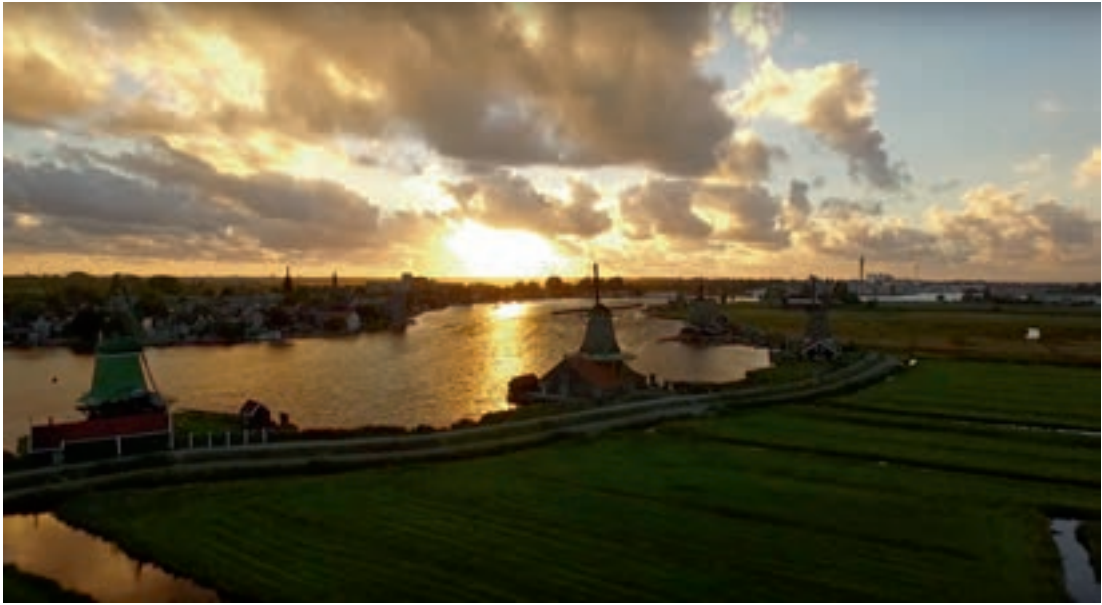
Ons cultureel erfgoed komt bij zonsondergang nog eens extra tot haar recht. Video: bit.ly/ZaanseSchans .

Dit boek houdt niet op bij de laatste bladzijde. Op Dronewatch.nl wordt u dagelijks bijgepraat over de laatste ontwikkelingen. Via het forum DronePilots.nl kunt u in contact komen met andere dronevliegers. Uw mooiste luchtopnamen deelt u via PixAir.nl , en op Vliegjedroneveilig.nl kunt u de regels voor het vliegen met drones in begrijpelijke taal terugvinden. Tot slot kunt u op Dronevideomaken.nl terecht voor updates en aanvullende tips.