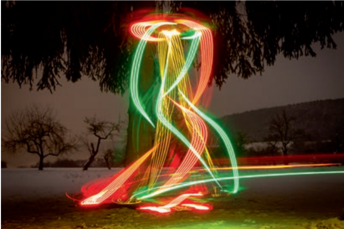
Deze foto van een drone in actie werd genomen met een lange sluitertijd. Hierdoor zijn de verschillende kleursignalen die een drone afgeeft goed te zien.

tus van de drone is: gereed om te vliegen, geen GPS ontvangst, batterij bijna leeg enzovoort. De precieze betekenis van de signalen verschilt per drone en zult u dus moeten opzoeken in de handleiding.