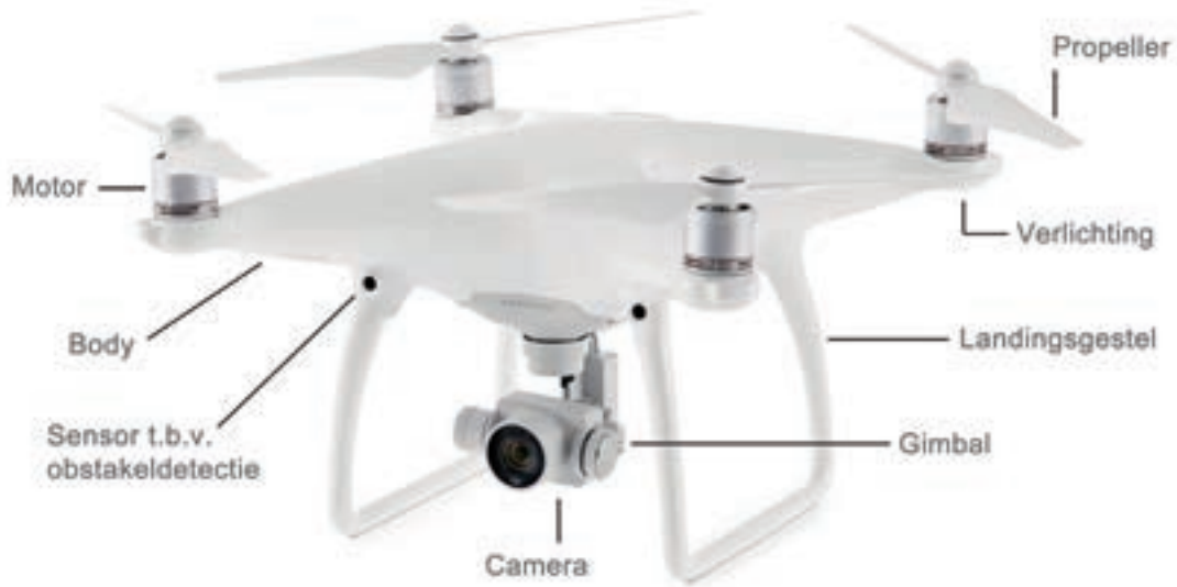
De belangrijkste zichtbare onderdelen van een ready to fly cameradrone.

Veel mensen die met dronevideo aan de slag gaan kiezen daarom voor een ready to fly drone die compleet met camera wordt geleverd. Deze modellen zijn in korte tijd zeer populair geworden. Bij dergelijke drones zijn de camera's zo licht mogelijk gehouden en bovendien naadloos geïntegreerd met de ophanging en de afstandsbediening. In de opsomming hieronder wordt uitgegaan van zo'n systeem.