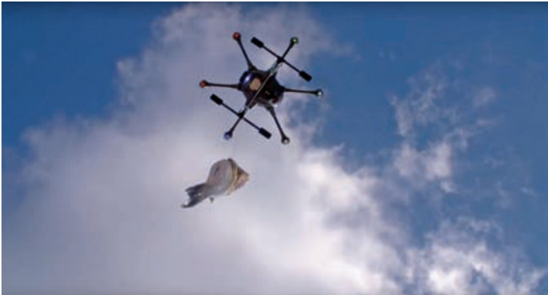
Heel soms speelt de drone zelf ook een hoofdrol in een filmproductie. Zoals in deze drone fishing video, die u kunt bekijken via bit.ly/dronevissen .