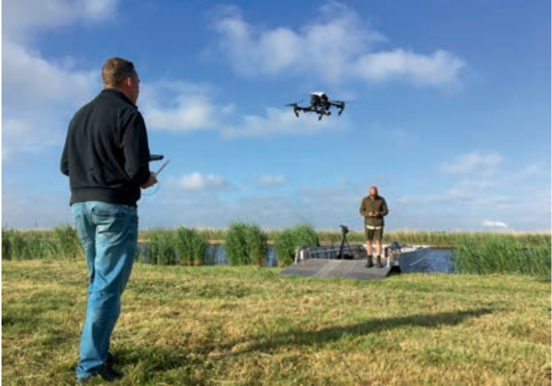
Een draaidag in een Noord-Hollands natuurgebied. U komt als dronepiloot soms op de mooiste plekken!

Ik heb zelf de afgelopen jaren op de mooiste plekken dronevideo's mogen maken, zowel hobbymatig als professioneel. De invoering van de zogeheten minidrone-regeling op 1 juli 2016 maakte het eindelijk mogelijk om in opdracht met drones te mogen vliegen. Natuurlijk krijgt ook u te maken met wet- en regelgeving, of u nu als hobbyist of als professional vliegt. Meer hierover en over het zogeheten ROC-light leest u ook in dit boek.