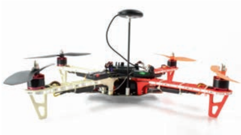
Op deze zelfbouwdrone is de GPS-ontvanger duidelijk zichtbaar.