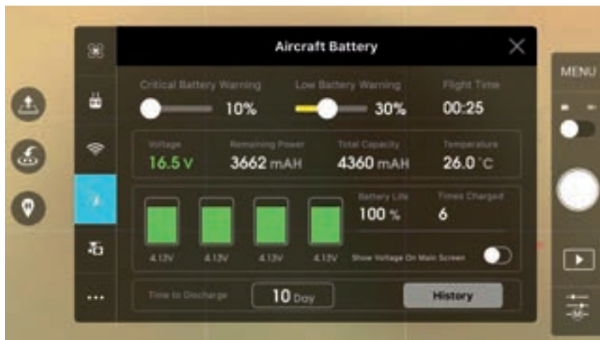
In de DJI Go-app kunt u de status van uw accu's controleren. U ziet onder andere hoeveel laadcycli de accu heeft doorgemaakt en over hoeveel dagen de accu automatisch deels ontladen wordt.