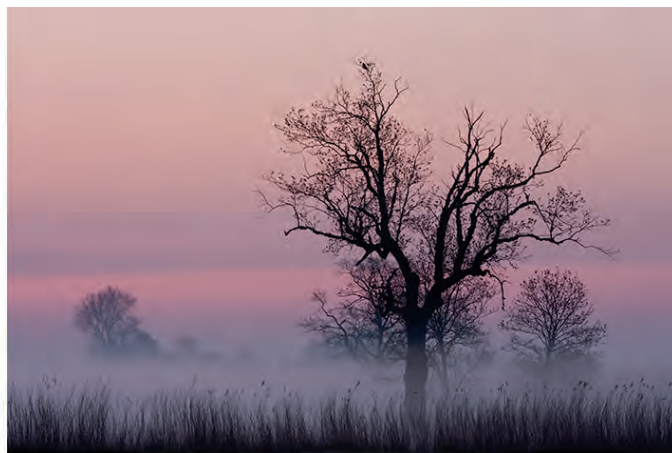
Zelfde onderwerp overdag of 's ochtends vroeg.