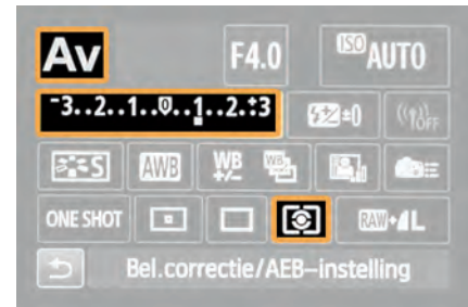
Diafragma voorkeur, Belichtingscompensatie (+1 Ev) en Matrixmeting (v.l.n.r.).

In plaats van het belichtingsprogramma Diafragma voorkeur (A-stand) kunt u ook kiezen voor Program (P-stand). U heeft dan met Belichtingscompensatie nog steeds volledige controle over de belichting van uw opnamen, maar u hoeft zich geen zorgen meer te maken over het diafragma en u kunt uw aandacht volledig richten op het onderwerp. Wilt u alles over de P-stand weten, zoals bijvoorbeeld Program Shift, kijk dan eens naar dit artikel op EOSzine.nl: http://bit.ly/1xdDR5k