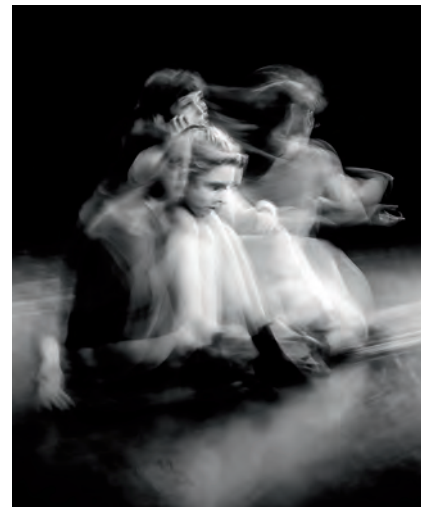
Snel een foto nemen van een 'snel' onderwerp. Gelukt of mislukt?

Met een halsriem, volle accu (+ reserve) en leeg geheugenkaartje (+ reserve) is de kans op een misser al een stuk kleiner. Als u dit lijstje met voorzorgsmaatregelen nog aanvult met een goede cameratas, dan beschermt u tevens uw kostbare apparatuur tegen stoten, vuil en vocht en hebt u er langer ongestoord plezier van. Hebt u toch een mankement aan uw camera of lens, kijk dan of dit onder de garantie valt. Zorg daarom dat u altijd de originele rekening en de complete verpakking netjes bewaart.