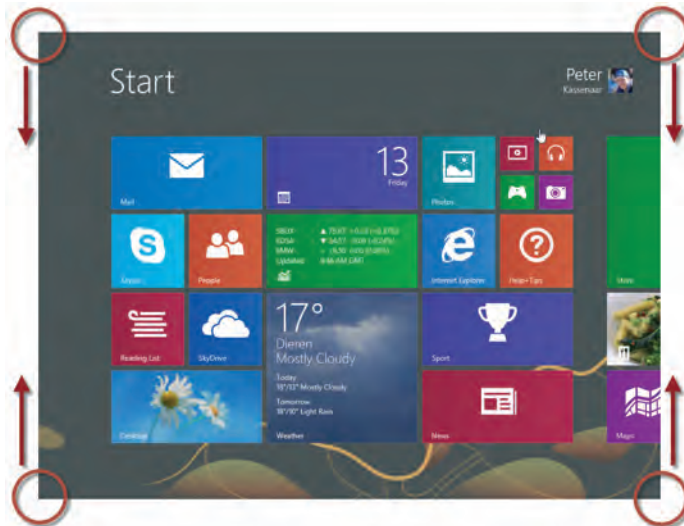
Afbeelding 1.3 Elke hoek van het Windows 8.1-scherm heeft een bepaalde betekenis als u er met de muis naartoe beweegt. In hoofdstuk 2 leest u hier meer over.

Windows 7 was zonder twijfel een succesvolle opvolger van het min of meer geflopte Windows Vista. Toch kon Microsoft na het uitbrengen van Windows 7 niet op zijn lauweren gaan rusten. Om daar een verklaring voor te geven volstaat één woord: iPad.