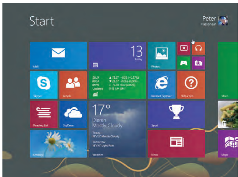
Afbeelding 1.2 Elk Windows 8.1-apparaat, of het nu een bureaubladcomputer of een tablet is, gebruikt het nieuwe startscherm met de kenmerkende tegels.

De lijst met vernieuwingen in Windows 8.1 is erg lang. Allerlei onderdelen zijn grondig herzien. Van de opstartbestanden tot de grafische schil, van meegeleverde apps tot de opstarttijd van Windows. Het is onmogelijk (en ook erg saai) om in een lange lijst een compleet overzicht van alle verbeteringen te geven. We beperken ons in deze inleiding daarom tot de meest in het oog springende opties, de kenmerken en programma's waar elke Windowsgebruiker vroeg of laat wel mee te maken krijgt. De hier genoemde onderdelen worden in de volgende hoofdstukken meer in detail besproken.