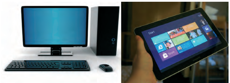
Afbeelding 1.4 Bureaucomputers en laptops gebruiken Intel-processors, tablets (rechts) zijn meestal gebaseerd op ARM-processors. Voor beide typen is een Windows 8.1-versie beschikbaar.

Windows 8.1 is de eerste versie van Windows die ook werkt op ARM-processors. Hiervoor is wel een aparte versie nodig, Windows 8.1 RT. U kunt