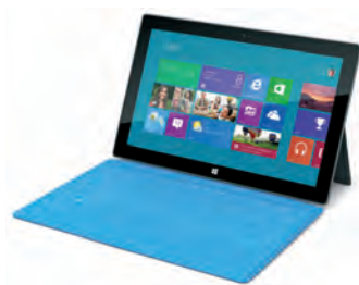
Afbeelding 1.1 Op tal van tablets zoals de Microsoft Surface is Windows 8.1 geïnstalleerd.

Het ligt voor de hand om te veronderstellen dat de meeste mensen vroeg of laat met Windows 8.1 in aanraking komen. U kunt besluiten de computer te vernieuwen door Windows 8.1 los in de winkel te kopen en uw huidige computer op te waarderen ( upgraden ). Meestal zult u kennismaken met Windows 8.1 omdat u een nieuwe computer of tablet hebt gekocht waarop Windows 8.1 al is geïnstalleerd. Dit boek is geschreven met dergelijke computergebruikers voor ogen.