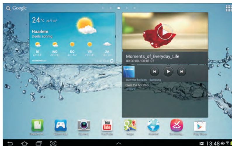
Het scherm van de Galaxy Tab.

Het belangrijkste onderdeel van uw tablet is natuurlijk het scherm, dat gebruikt u voor de communicatie met uw tablet. Het beeldscherm van uw tablet heeft een resolutie van 1024x600 pixels voor een 7-inch tablet, de grotere schermen hebben een resolutie van 1280x800 pixels. Het beeldscherm is een aanraakscherm, maar geen traditioneel aanraakscherm dat reageert op druk (resistief aanraakscherm). Uw Galaxy-tablet heeft een zogenoemd capacitief aanraakscherm, dat reageert op een elektrische geleider. Een resistief scherm bedient u met een stift, terwijl een capacitief scherm reageert op een elektrische geleider, zoals uw vinger.