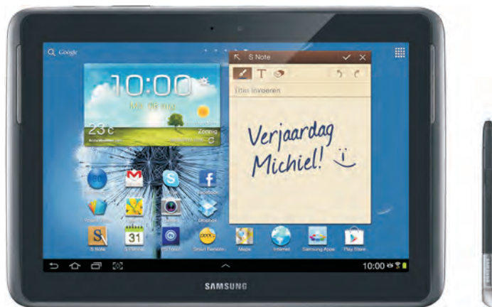
De Samsung Galaxy Note 10.1 N8000.

Zoals gezegd, de Galaxy Note en de Galaxy Tab lijken erg op elkaar, hoewel bij de Tab de pen en het infraroodlampje ontbreken. Ook de apps op de tablet zijn grotendeels gelijk en worden niet afzonderlijk behandeld. Zijn er belangrijke verschillen tussen de verschillende uitvoeringen, dan wordt dat duidelijk aangegeven. Tijd voor een eerste kennismaking met uw tablet.