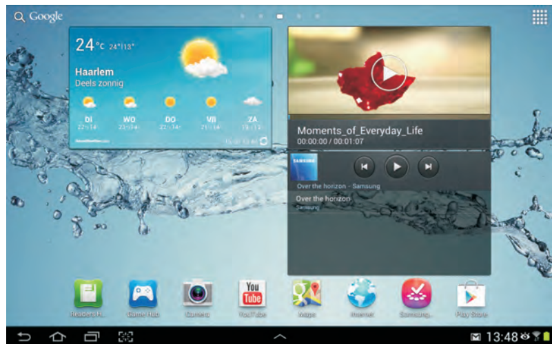
Het startscherm met rechtsboven de knop Apps.

Uw tablet is van huis uit al voorzien van een aantal programma's of toepassingen. Een toepassing – application in het Engels – wordt meestal kortweg app genoemd. In het startscherm ziet u rechtsboven de knop Apps . Tikt u daarop, dan opent u het scherm met apps. U ziet daar alle apps die op uw tablet zijn geïnstalleerd. Deze apps zijn klaar voor gebruik.