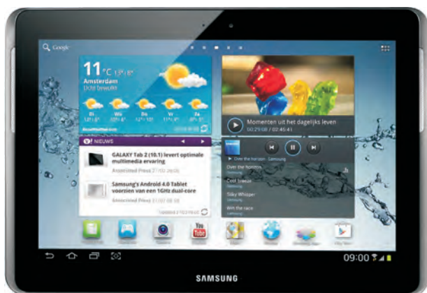
De Samsung Galaxy Tab 2 10.1 P5110.

De Galaxy Tab en de Galaxy Note zijn populaire tablets van Samsung. Deze tablets lijken uiterlijk erg op elkaar en ze zijn in verschillende uitvoeringen verkrijgbaar. Zo zijn er modellen met een scherm van zeven, acht of tien inch. Daarnaast is er van beide een versie verkrijgbaar die geschikt is voor het mobiele internet (3G of 4G) en telefonie, hoewel, een tablet met een tien inch scherm is nu niet bepaald een handige telefoon. Hebt u zo'n model, dan hebt u ook een simkaart nodig (prepaid of abonnement).