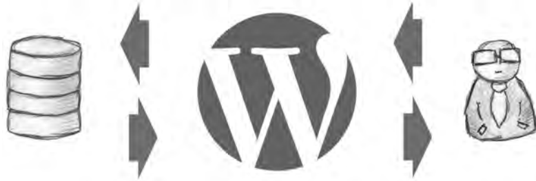
Afbeelding 1.1 WordPress haalt de gegevens uit de database (links) en toont die aan de bezoeker van uw site (rechts). Andersom gebeurt dit ook: wanneer u een bericht online zet, stopt WordPress het in de database.

Wanneer er op een site regelmatig nieuwe berichten moeten verschijnen, komt een cms in beeld. Alleen daarmee kunt u op gemakkelijke wijze nieuwe content toevoegen. Bovendien handelt het cms ook ingewikkelde taken af, zoals het doorzoeken van berichten of het presenteren van alle berichten in een bepaalde categorie.