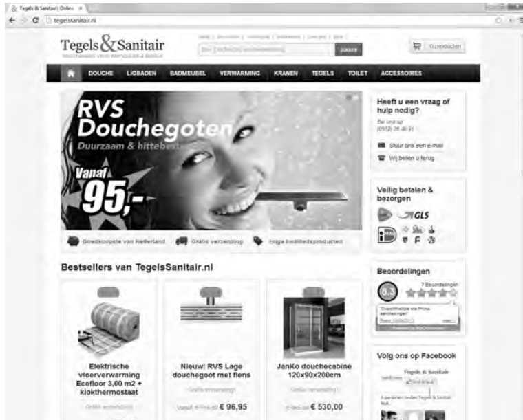
Afbeelding 1.7 Zelfs een webshop is mogelijk met WordPress.