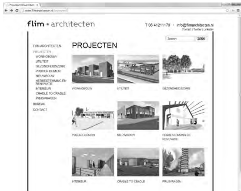
Afbeelding 1.6 Het architectenbureau Flim gebruikt WordPress als portfolio-site om projecten te tonen.