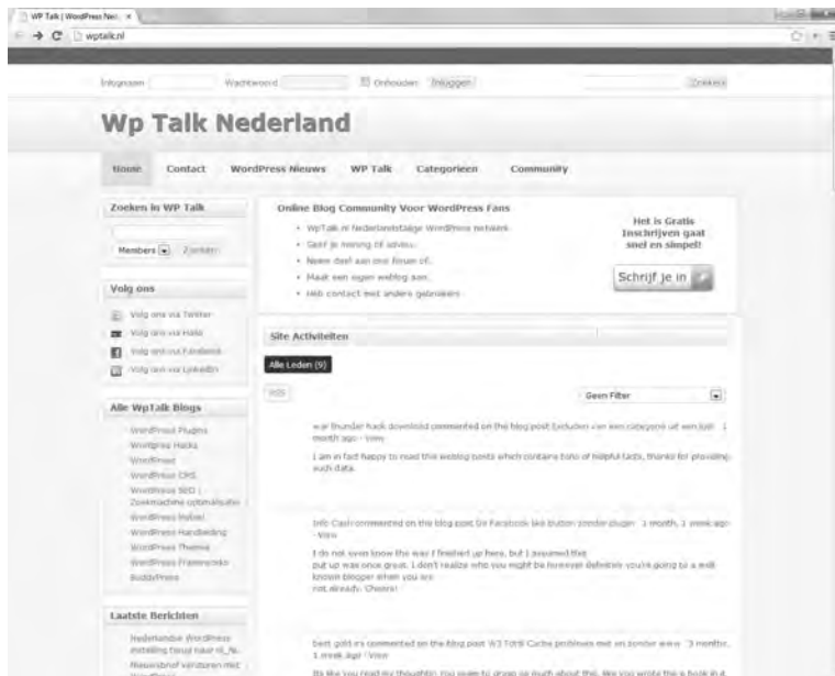
Afbeelding 1.8 Met de plug-in BuddyPress wordt WordPress een sociaal netwerk.