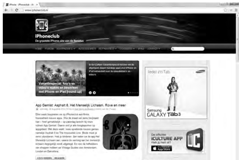
Afbeelding 1.3 De populaire iPhoneclub draait op WordPress. Een typisch voorbeeld van een weblog.