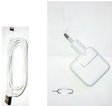
De accessoires van de iPad.

In de doos zit meer dan alleen uw iPad. In de omslag vindt u een boekje met productinformatie, daaronder treft u de accessoires aan.