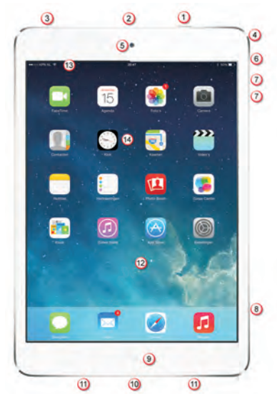
De onderdelen van uw iPad.

Een visuele inspectie van uw iPad is een goed startpunt. De iPad Air en iPad mini lijken sprekend op elkaar, alle onderdelen zitten op dezelfde plaats. Alleen de afmetingen van het scherm verschillen. De onderdelen op de foto hebben een nummer. In de tekst staat bij dat nummer de naam van het onderdeel met een korte beschrijving.