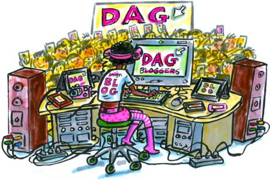
Een populaire blogger.