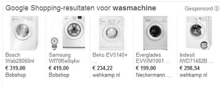
Afbeelding 1.4 Google Shopping-advertentie.

Google Shopping-advertenties zijn productvermeldingen met gedetailleerde productinformatie. Hiervoor hebt u ook een Google Merchant Center-account nodig. Google Shopping-advertenties zijn niet in alle landen beschikbaar, maar wel in Nederland.