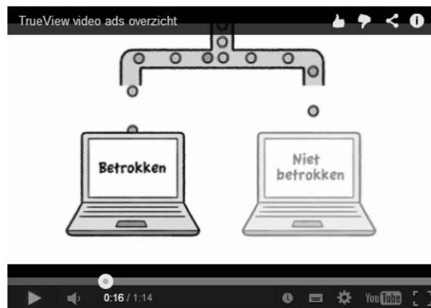
Afbeelding 1.6 Uitleg over TrueView-videoadvertenties op http://goo.gl/EZCs1U .

Tot zover een korte introductie in online adverteren, specifiek gericht op Google AdWords. In de volgende hoofdstukken leert u hoe u hier zelf mee aan de slag gaat.