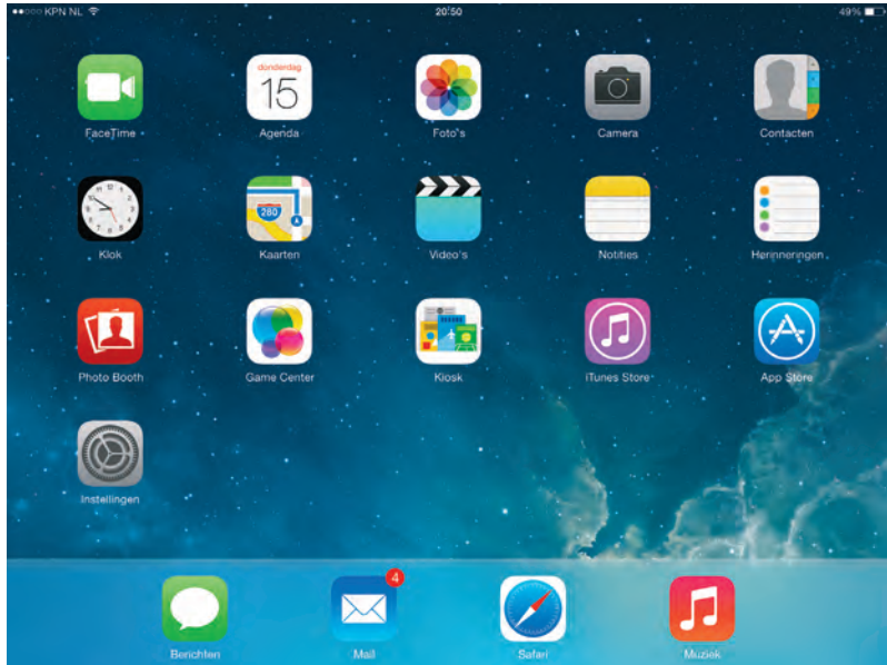
Het beginscherm van de iPad met iOS 7.

In september 2013 heeft Apple iOS 7 uitgebracht. Dit is een nieuwe versie van het besturingssysteem iOS voor de iPhone, iPad en iPod. iOS 7 is beschikbaar voor de iPhone 4, 4S en 5, de iPod Touch vijfde generatie, de iPad mini en de iPad 2 en opvolgers.