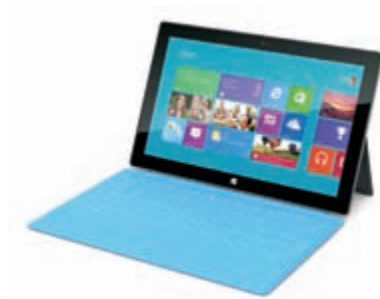
Afbeelding 1.1 Op tal van tablets zoals de Microsoft Surface is Windows 8 geïnstalleerd.

Het ligt daarom voor de hand om te veronderstellen dat de meeste mensen vroeg of laat met Windows 8 in aanraking komen. U kunt besluiten de computer te vernieuwen door Windows 8 los in de winkel te kopen en uw huidige computer op te waarderen ( upgraden ).