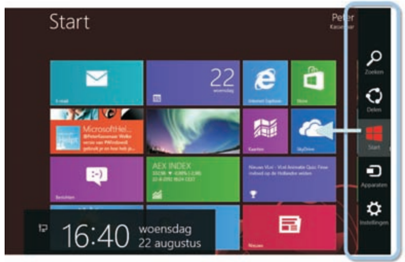
Afbeelding 1.5 Charms zijn een centraal bedieningsorgaan in Windows 8. U toont de charmbalk door met uw vinger van rechts naar links te slepen of beweegt met de muis vanuit de rechter boven- of benedenhoek naar het midden (zonder te klikken!).