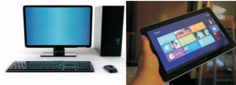
Afbeelding 1.4 Bureaucomputers en laptops gebruiken Intel-processors, tablets (rechts) zijn meestal gebaseerd op ARM-processors. Voor beide typen is een Windows 8-versie beschikbaar.

Windows 8 is de eerste versie van Windows die ook werkt op ARM-processors. Hiervoor is wel een aparte versie nodig, Windows 8 RT. U kunt deze niet los kopen. Hij wordt altijd door de fabrikant van de tablet voorgelanceerd op het apparaat.