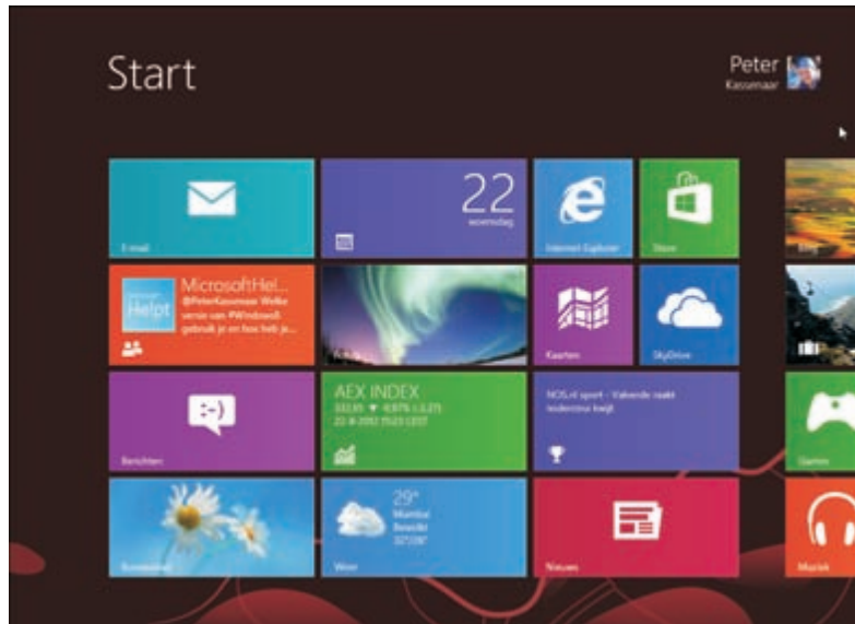
Afbeelding 1.2 Elk Windows 8-apparaat, of het nu een bureaubladcomputer of een tablet is, gebruikt het nieuwe startscherm met de kenmerkende tegels.