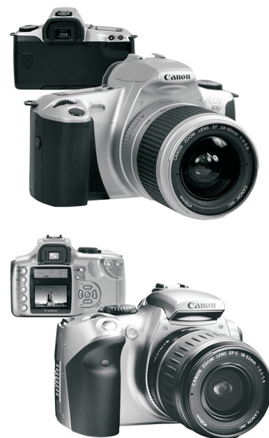
Nieuwe wijn in 'oude' zakken: twee spiegelreflexcamera's waarvan de digitale versie alleen te onderscheiden is aan het lcd-scherm en de knopjes aan de achterzijde.

Wij wensen u veel leesplezier en hopen dat u antwoord vindt op uw vragen en geen belemmeringen meer tegenkomt in het maken van fantastische foto's.